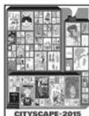
KIDPRINT! CITYSCAPE FALL 2015