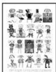
FUN FIGURE KIDPRINT! FALL 2014