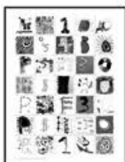
THE DEBUT KIDPRINT! FALL 2013